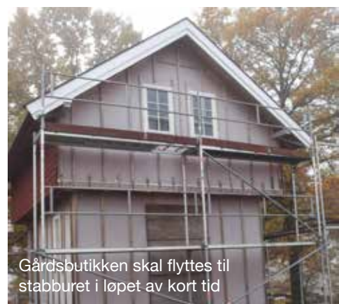
Gårdsbutikken skal flyttes til stabburet i løpet av kort tid