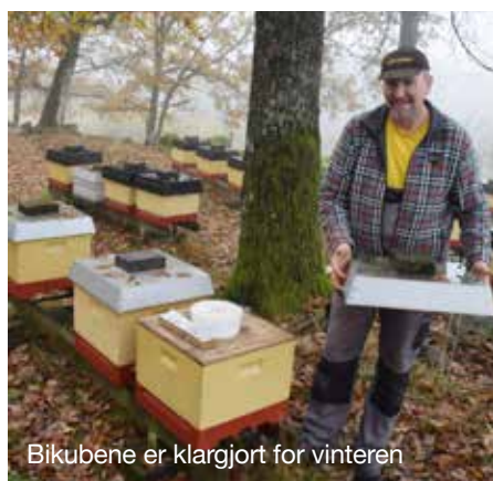
Bikubene er klargjort for vinteren